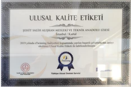
Ulusal Kalite Etiketi "etwinnig"