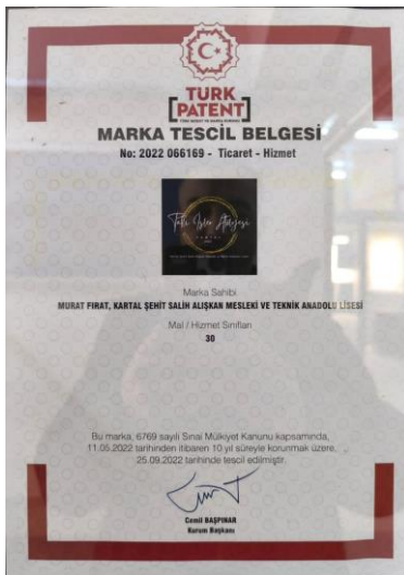
Marka Tescil "Tatlı İşler Atölyesi"