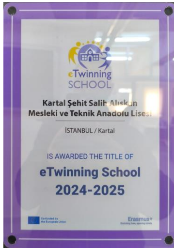
etwinning "Okul Etiketi"