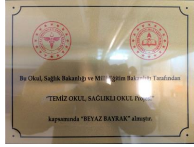
Okulum Temiz "BEYAZ BAYRAK"