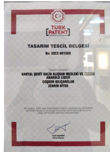
Tasarım Tescil "Ağaç Dallarından Elbise"